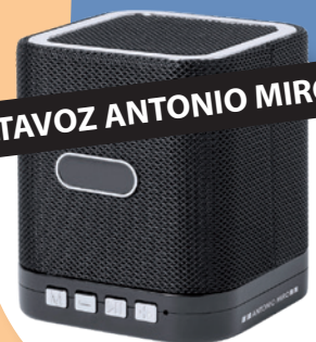
ALTAVOZ ANTONIO MIRÓ