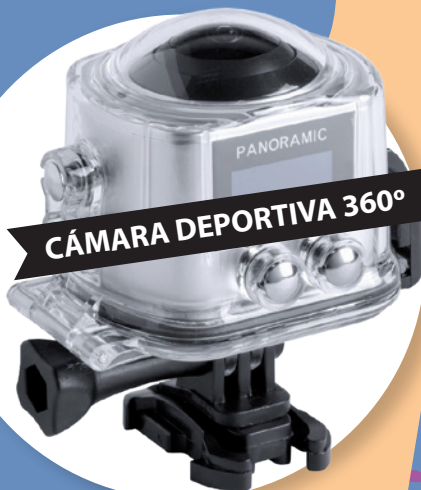
CÁMARA DEPORTIVA 360°